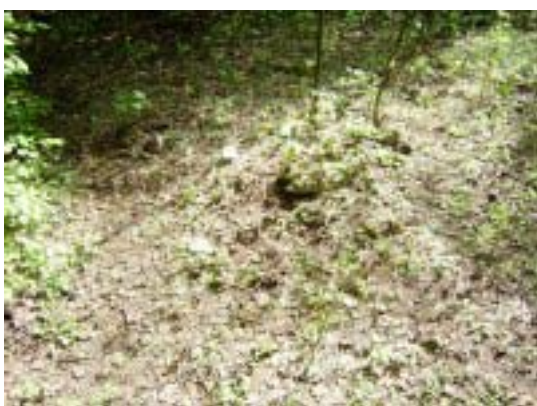
Fotografia číslo 6