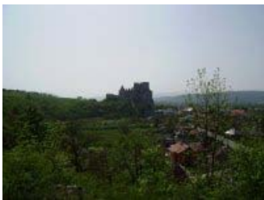
Fotografia číslo 8