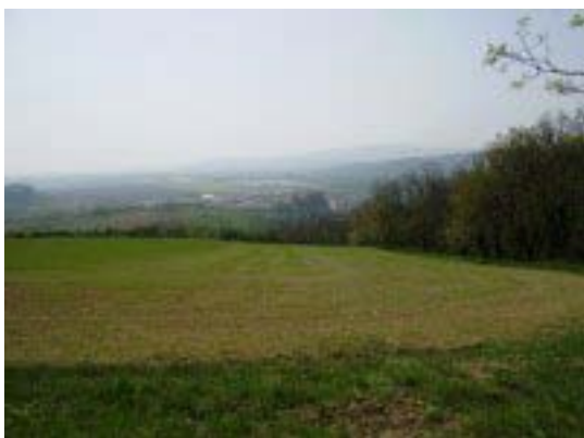
Fotografia číslo 7