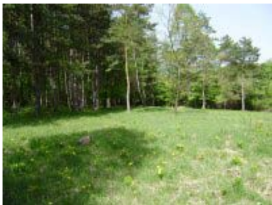
Fotografia číslo 5