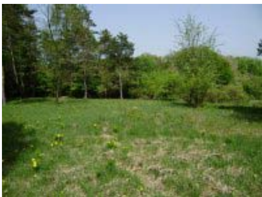
Fotografia číslo 4