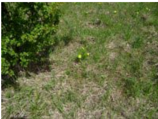
Fotografia číslo 2