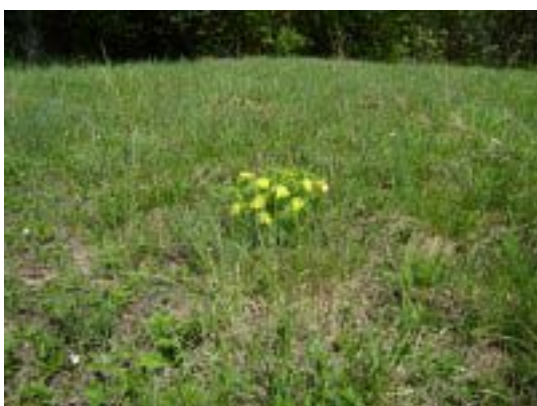
Fotografia číslo 3