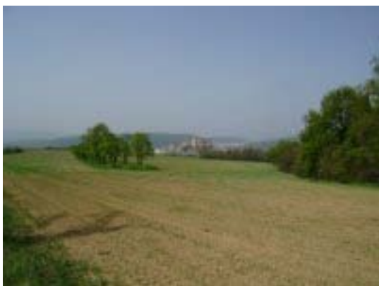
Fotografia číslo 1